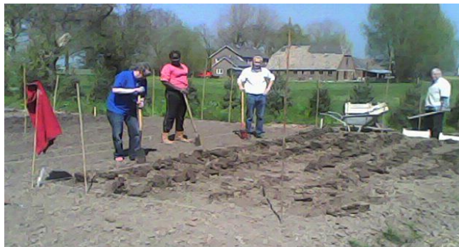
Het potten van de aardappelen

Het initiatief hiervoor kwam van de tuincommissie.