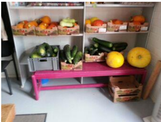
Oogst van courgettes en pompoenen

De ruimte tussen Voedselbank en Toetenburgers zal worden ingericht als opslag van tuinmateriaal, zoals stokken, planken, etc. Hier kunnen dan ook te zijner tijd compostbakken geplaatst worden.