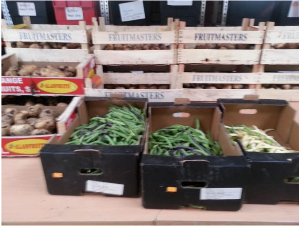
Oogst van de boontjes